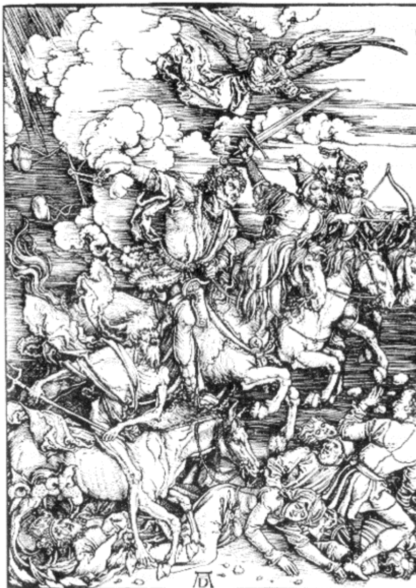
A. Dürer: APOKALYPTIČTÍ JEZDCI