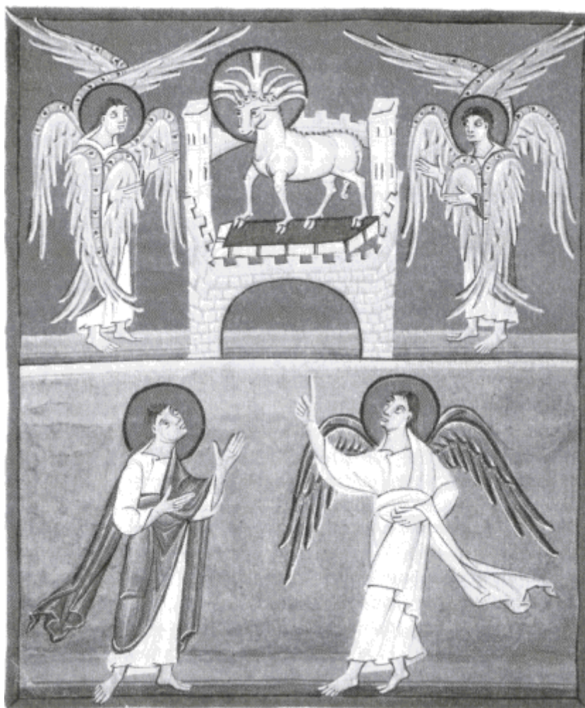
BERÁNEK. Bambereská apokalypsa