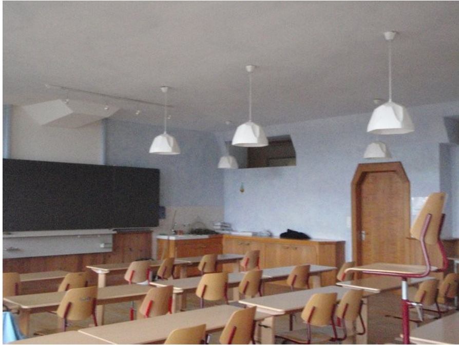
Třída odborných předmětů